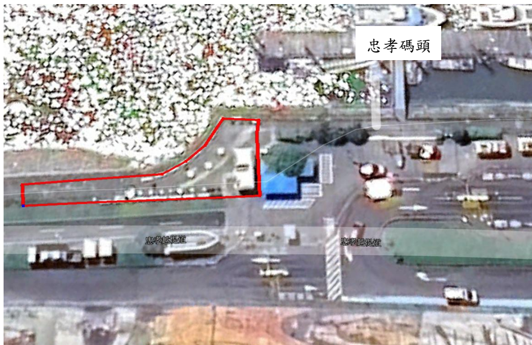
圖 2. 忠孝碼頭招租範圍(約 270 平方公尺)示意圖